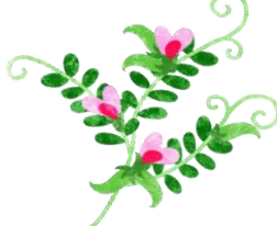
カラス / エンドウ

土筆 (つくし) は沢山 摘んで袴を取ります。 数回水を替えてアクを 抜き、熱湯で湯がきま す。その後水に晒し アクを抜いて絞ります。 出し汁に醤油、砂糖な どで味付け、土筆を煮 て、溶き卵でとじたら 「つくしの卵とじ」の 出来上がりです。